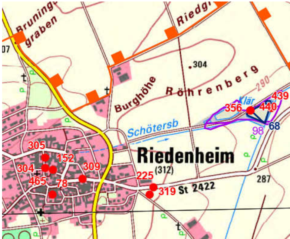
Planausschnitt ohne Maßstab

Gemäß einer aktuellen Datenabfrage beim Landesamt für Umweltschutz befinden sich im Plangebiet keine Einträge.