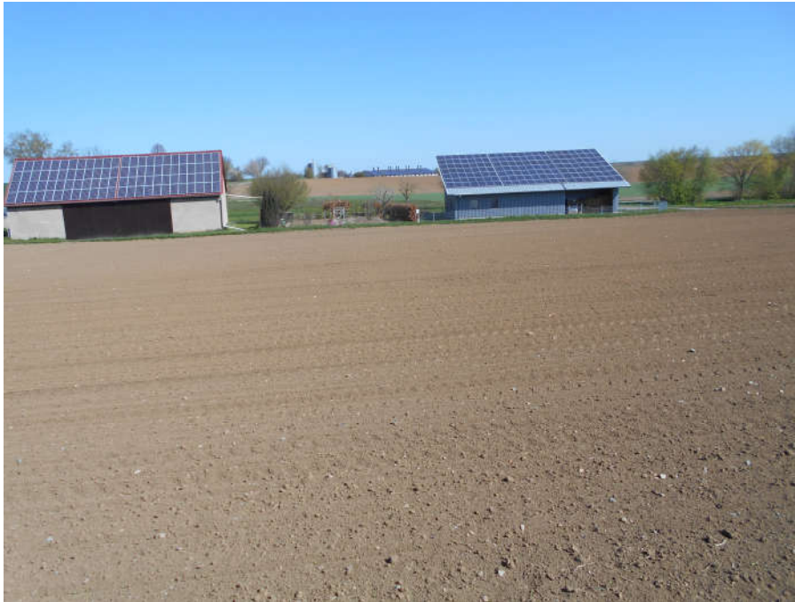
Blick über das Plangebiet von Süden in nördliche Richtung

Das Plangebiet liegt am östlichen Ortsrand von Riedenheim östlich der Staatstraße St 2268. Der Geltungsbereich ist durch intensive Ackernutzung sowie bestehende Gebäude mit zwischenliegenden Gartenbeeten geprägt. Nördlich der bestehenden Gebäude und außerhalb des eigentlichen Eingriffsbereiches befindet sich der Schötersbach (Graben) und eine Obstbaumreihe (Apfel, Birne, Walnuss). Im Plangebiet befinden sich weder kartierte Flächen der amtlichen Biotopkartierung noch gemäß § 30 BNatSchG und Art. 23 BayNatSchG geschützte Flächen.