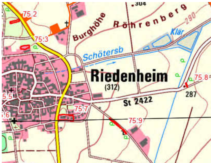
Planausschnitt ohne Maßstab

Im Plangebiet befinden sich keine kartierten Flächen der amtlichen Biotopkartierung.